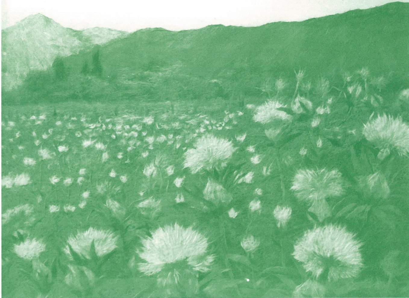
アートコンクール2017出展作品 最優秀賞「紅花畑」