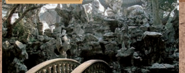
世界遺産に登録されている9つの「蘇州古典園林」の一つ。自然の地形を生かした庭園美が見事です。