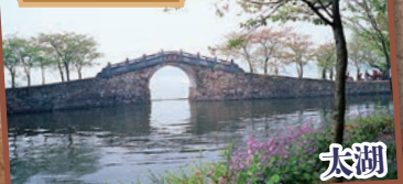
中国で3番目に大きい淡水湖。風光明媚な景色を眺めます。