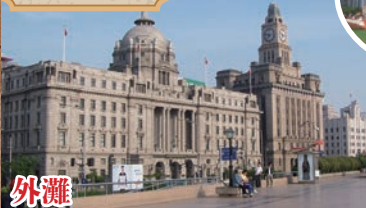
租界時代の欧風建築が並び、対岸には浦東の摩天楼が望める人気スポット。