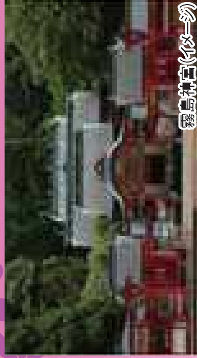
霧島神社(伊弉一羽)