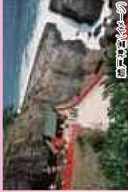
鶴戸神社(伊弉一羽)

■ 宿泊 / 宮崎・青島 → 青島グランドホテル 鹿見島: 霧島温泉 → 霧島イヤルホテル