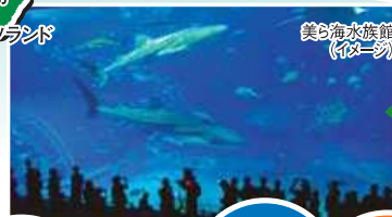
美ら海水族館(イメージ)