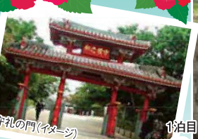
守礼の門(イメージ)