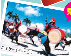
エイサー(イメージ)