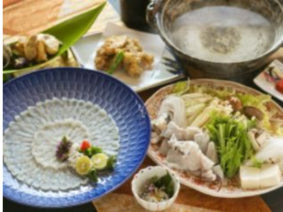
とらふぐ料理イメージ