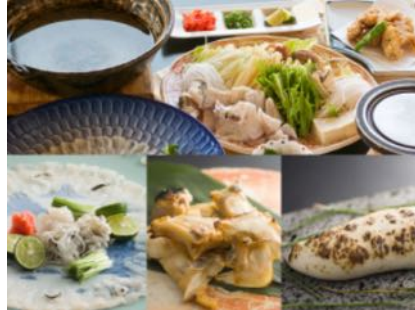
とらふぐ料理イメージ