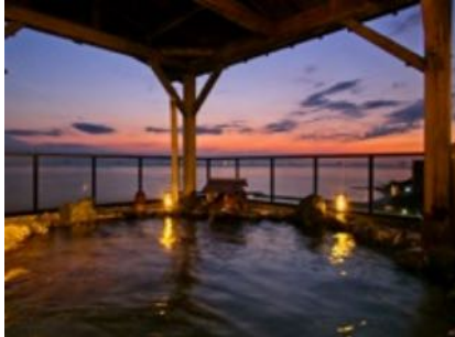
夕日の見える露天風呂