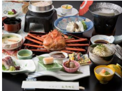
北陸の海の幸会席(冬季限定)