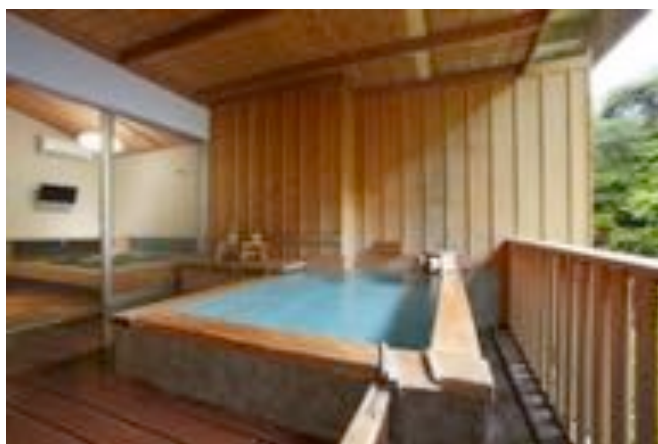
↑ 源泉掛け流しの貸切露天風呂(愛媛・奥道後 壱湯の守)