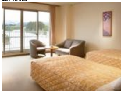
剣岳が見える部屋