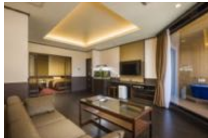
ハイクラス別館「ふらり」