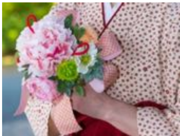
↑ 花束進呈サービス(伊勢・千の杜)