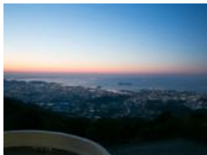
お部屋から見える夕焼け