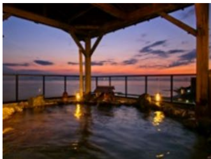
夕日の見える露天風呂