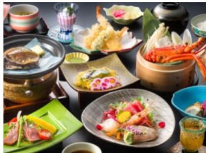
アワビ付き海舟の膳