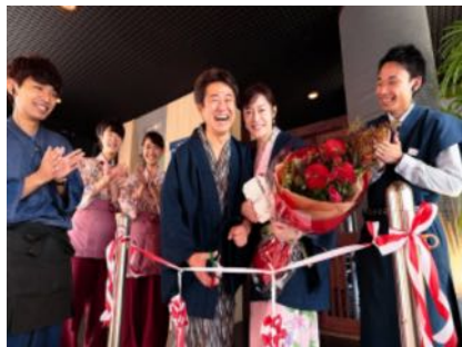
テープカットでお祝い