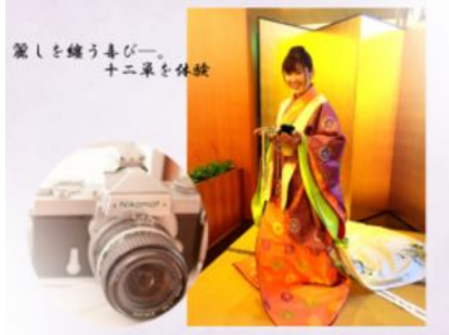
十二単 & 撮影サービス