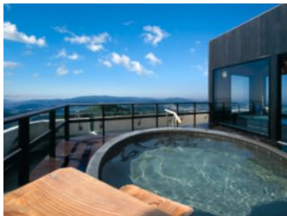
露天風呂からの景色