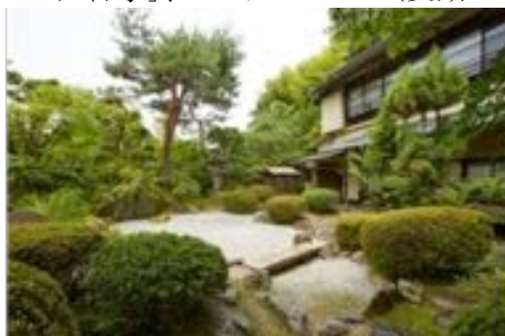
↑「坪中川」庭園 枯山水