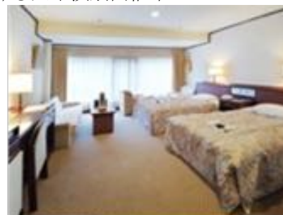
↑本館スタンダードツイン