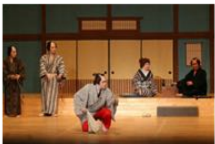
↑大衆演劇イメージ