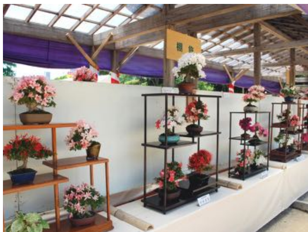
↑ 奥道後さつき展(昨年の様子)

「第47回奥道後さつき展」では、愛好家の皆様が丹念に育て上げた、色鮮やかなさつきの観賞に加えて「スタンプラリー」「あなたが選ぶ総理大臣賞（人気投票）」「即売会」などもお楽しみいただけます。奥道後 壺湯の守では、特別プランを提供します。