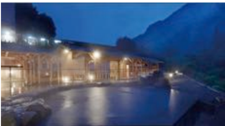
↑西日本最大級露天風呂『翠明の湯』