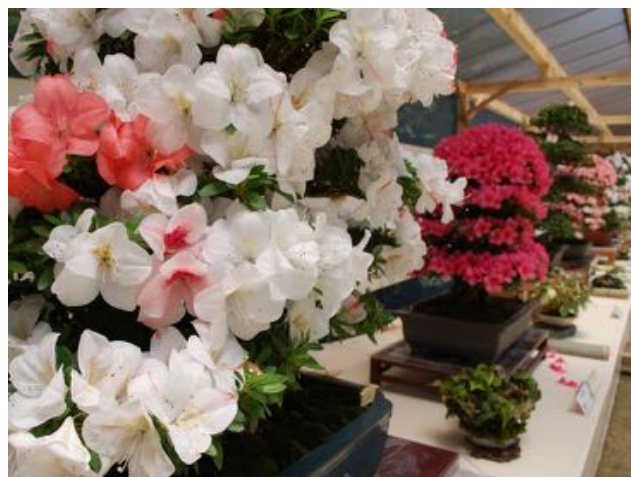
↑ 奥道後さつき展(昨年の様子)