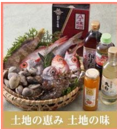
土地の恵み 土地の味