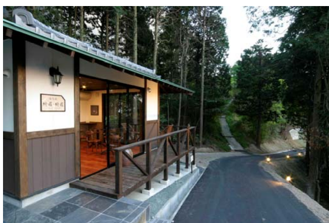
▲風の散歩道で出会うアート達