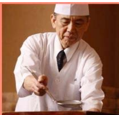
取り合わせ 調理法