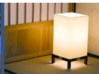
▲さくら色に切り替えられる照明