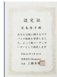
▲枕コーディネーター認定証