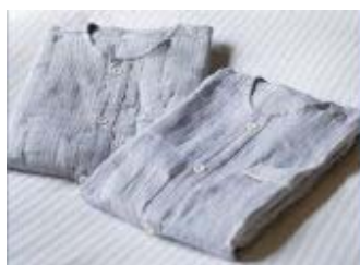
▲ガーゼのパジャマ