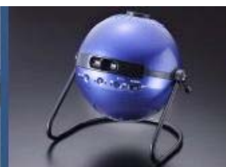
▲室内プラネタリウム