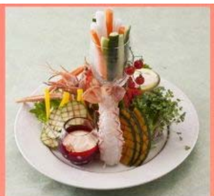
色で楽しむ食材の力