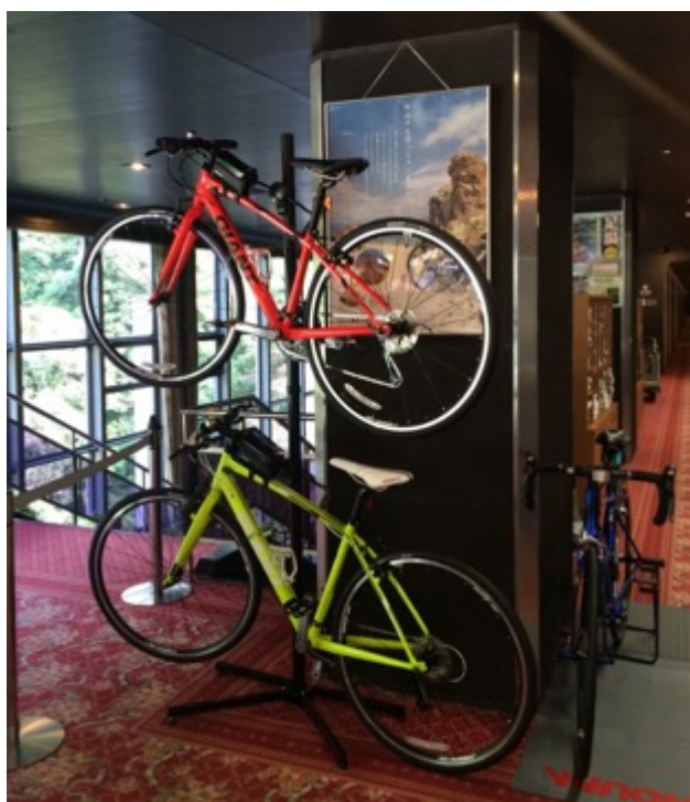
GIANT ESCAPE RX3 (size S XXS)

奥道後 壺湯の守にも、サイクリストなど自転車愛好家のほか、地元の方も自転車で来館される機会が増加し、家族や女子旅、ひとり旅の旅行者からの問い合わせが増加していることから、このほどGIANT社製自転車を導入し、レンタルサービスを始めます。