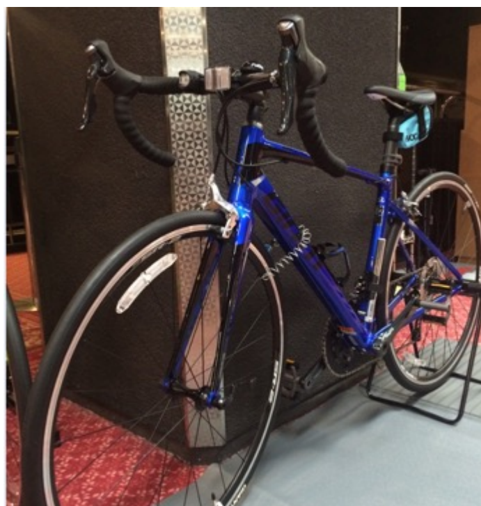
GIANT Defy2 (size S)