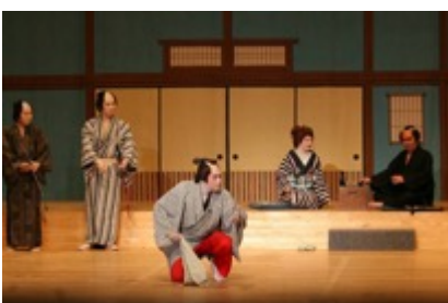
↑大衆演劇イメージ