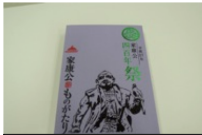
家康公顕彰 400 年オリジナル御朱印帳