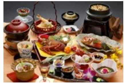
夕食「家康鍋」付き会席料理