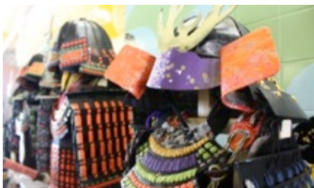
試着体験できる簡易甲冑