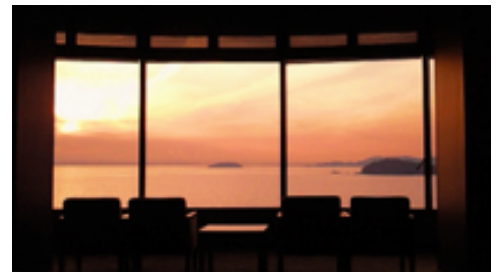
夕日の見えるロビー