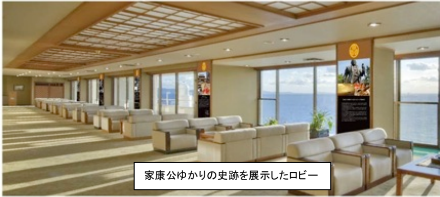
家康公ゆかりの史跡を展示したロビー

当館名「たつき」は、岡崎城の別名「龍城」から拝しており、徳川家康公顕彰400年を機に本格的に“武将の館”をテーマにしていきます。たつきの「徳川家康と家臣の武勇体感プロジェクト」第一弾では、玄関に、元康、後の徳川家康公が永禄三年(1560年)に大高城兵糧入れで手柄を立てたときに着用していたと伝えられる甲冑「金陀美具足(きんだみぐそく)」(等身大レプリカ)を展示しています。また、ロビーの柱には、当館の周辺に点在する家康公とゆかりの深い史跡、「家康公の母「於大の方」ゆかりの安楽寺」や「龍城(岡崎城)」、「於大の方の姉と家康公に縁のある形原城」などを写真とともに紹介しています。