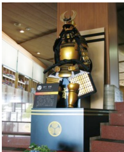
フロント前、徳川家康甲冑「金陀美具足」