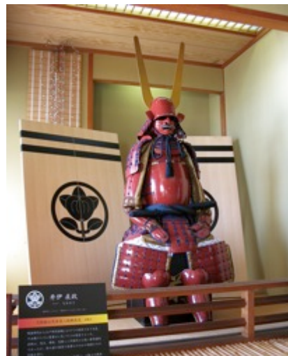
2階ロビー、井伊直政甲冑