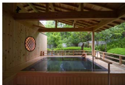
千の杜 温泉露天風呂