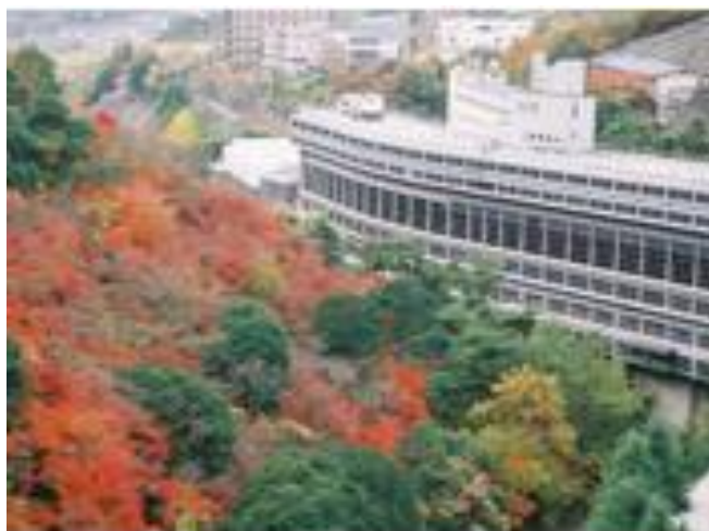
↑奥道後 壺湯の守の紅葉(全景)

「第48回奥道後菊花展」では、菊愛好家の皆様が丹念に育て上げた、色鮮やかな菊花の観賞に加えて「菊花スタンプラリー」「あなたが選ぶ総理大臣賞(人気投票)」「菊即売会」などもお楽しみいただけます。奥道後 壺湯の守では、特別プランを提供します。