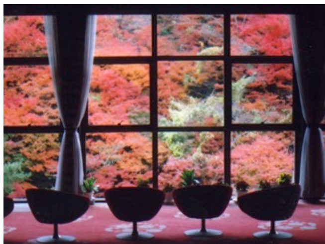
↑奥道後 壺湯の守の紅葉(ロビー・ラウンジから)