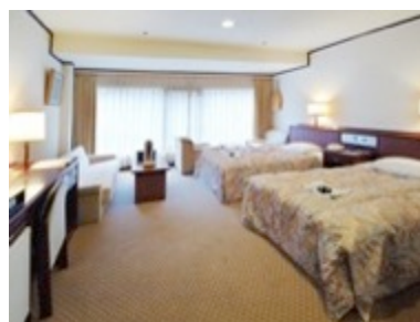
↑ 本館スタンダードツイン