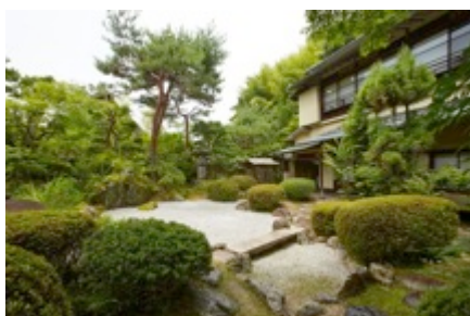
↑ 「坪中川」庭園 枯山水