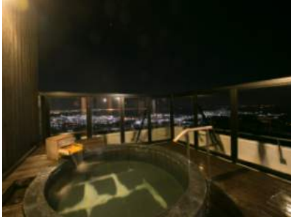
露天風呂からの夜景