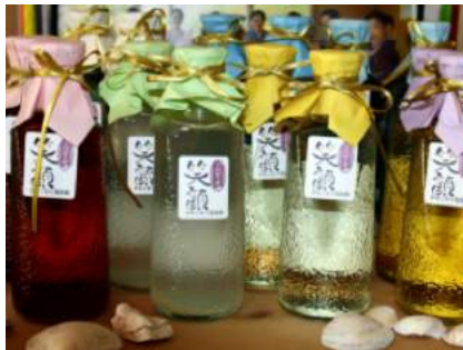
女将の会リキュール「笑顔」の一例

http://www.7.489ban.net/v4/client/plan/detail/customer/tatsuki/plan/113929