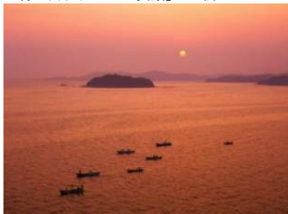
ロビーからご覧いただける、落陽シーン