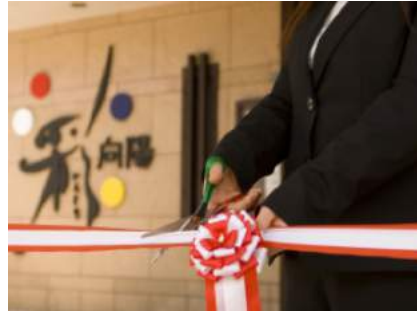
お祝い専用サービス

http://www.7.489ban.net/v4/client/plan/detail/customer/gh-koyo/plan/33785