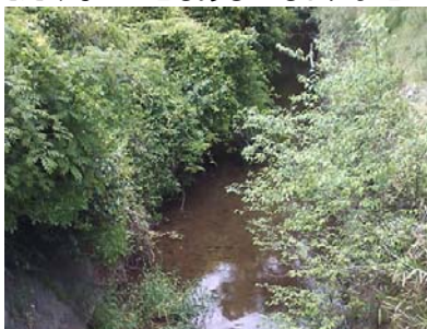
ホタル観賞予定地

※ホタルがご覧いただけないこともあるかもしれませんが自然のままでございますのでご了承くださいませ。