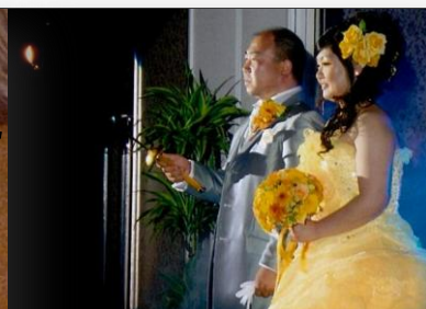
2012.4.28 Wedding Story