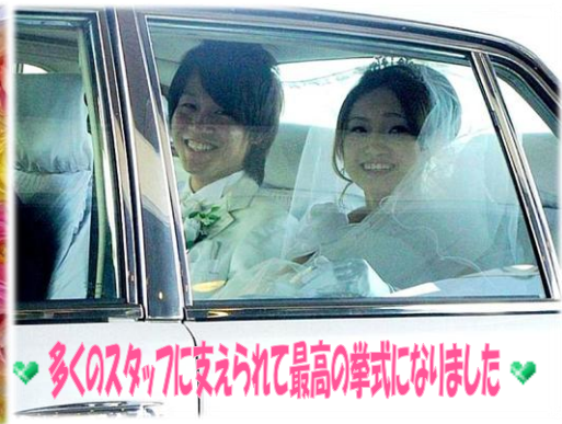
多くのスタッフに支えられて最高の挙式になりました