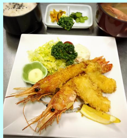
ボタンエビフライと イカフライ御膳 1,620円 (ボタンエビ2尾、イカ2ヶ入)