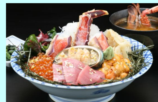
竜宮井 (活アワビ刺し、ウニ、トロ、タラバ刺し) 本日の価格 6,500円

揚げ物と、お刺身の調理場が別々になっておりますので、 お料理をお出しする順番が前後することがございます。 何卒、ご了承くださいませ。