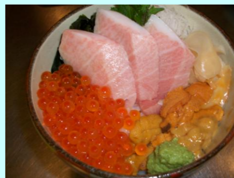
宝井 (トロ、ウニ、イクラ) 本日の価格 3,500円

当店のいけすレストランのご飯は、新潟県長岡産コシヒカリのお米を使用しております。 なお、当店のお味噌汁は、魚介類・野菜を使った寺泊名物・番屋汁でございます。 番屋汁がなくなり次第、海藻汁に変更になります。 また、お料理内容は季節や入荷状況によって変更になる場合がございます。 スタッフまで、お気軽におたずね下さいませ。