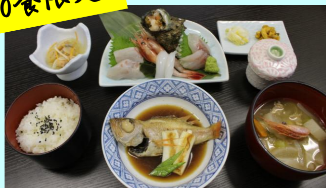
のどぐろ煮付け 活サザエ入り刺身御膳 2,500円 (小鉢、茶碗蒸し付き)