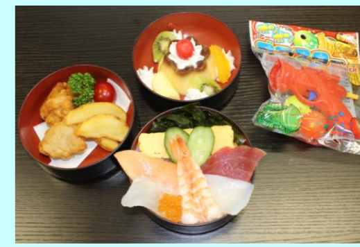
お子様寿司ランチ 930円 (海鮮チラシ、とり唐揚げ、ポテト、 プリンアラモード、おもちゃ付)

※当店は全て税込表示でございます。 裏面にもおすすめ単品メニューがございます。ご覧くださいませ。