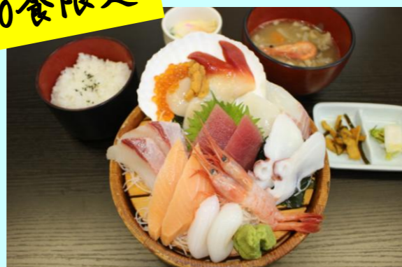
刺身御膳 1,800円 (お刺身 十二種盛り、茶碗蒸し)