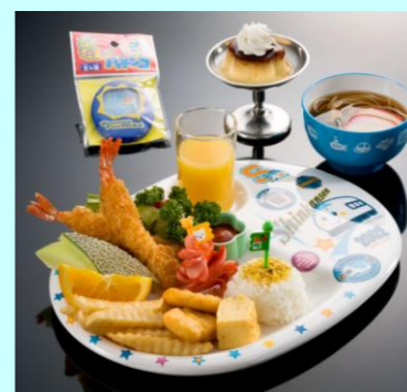
お子様プレートランチ 730円 (おにぎり、エビフライ、ウインナー、ナゲット、 ポテトフライ、フルーツ等、うどん、ジュース、おもちゃ付)