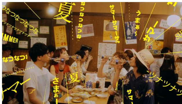
(Czecho No Republic 居酒屋篇)