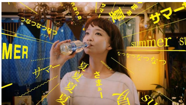
(タカハシマイ 家飲み篇)

『ZIMA“もっとサマーを”キャンペーン』スタートに際し、SNS をはじめとしたデジタルメディアにて Czecho No Republic 出演の WEB-CM を公開・配信します。書き下ろし楽曲「Baby Baby Baby Baby」とともに、彼らが熱い夏をチャージし、満喫するリアルなシーンを描いた WEB-CM です。また ZIMA.JP では、ロングバージョンも公開。これまで見たことのない Czecho No Republic の一面に出会えること間違いなしです！