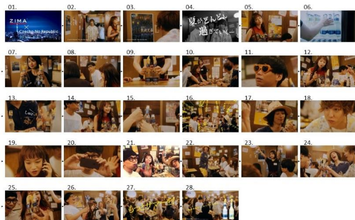
(Czecho No Republic 居酒屋篇)