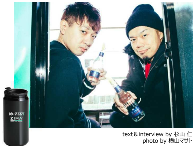
text&interview by 杉山 仁