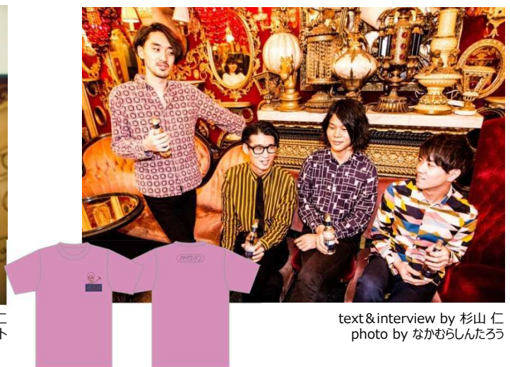
text&interview by 杉山 仁