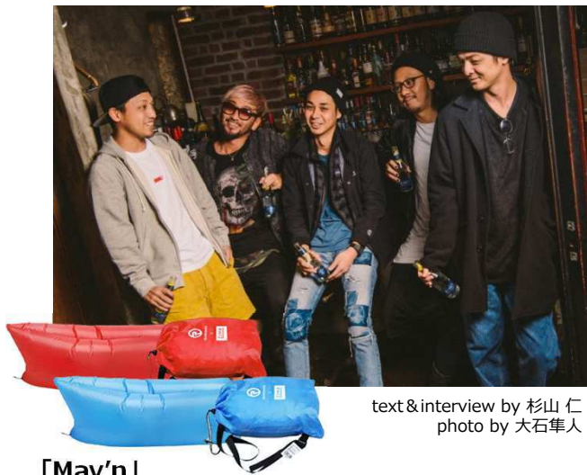
text&interview by 杉山 仁