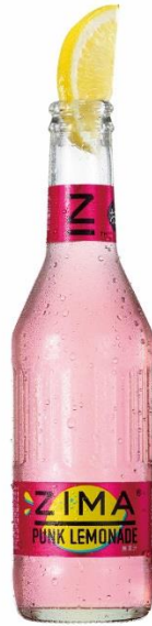
ZIMA PUNK LEMONADE (ジーマ パンク レモネード)