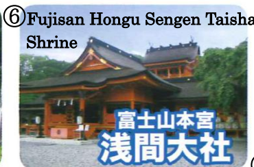
⑥ Fujisan Hongu Sengen Taisha Shrine

国の名勝及び天然記念物、日本の滝百選に選定され、富士山の雪解け水が絶壁から湧き出す景色は優しく、女性的な美しさで、滝壺近くに立つと幻想的な世界を見せてくれます。