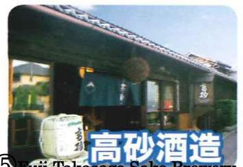
⑤ Fuji Takasago Sake Brewery

大同元年(806年)建立、国内に約1300社ある浅間神社の総本宮である。境内は本宮がある市街地と富士山頂上にある奥宮境内の二つに分けられている。本殿は国重要文化財。