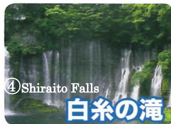
④ Shiraito Falls 白糸の滝

富士山の優美な風貌は、国内外で日本の象徴として広く知られています。富士山麓周辺にはキャンプ場や観光名所が多くあり、山頂の気候区分はツンドラ気候に分類される。