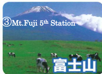
③ Mt. Fuji 5th Station

※座席予約制となっております。予め申し込み下さい。(当日受付もできます。但し空席がある場合のみ) ※幼児でも座席を使用する場合は、子供運賃が必要となります。