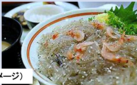
生しらす丼(イメージ)