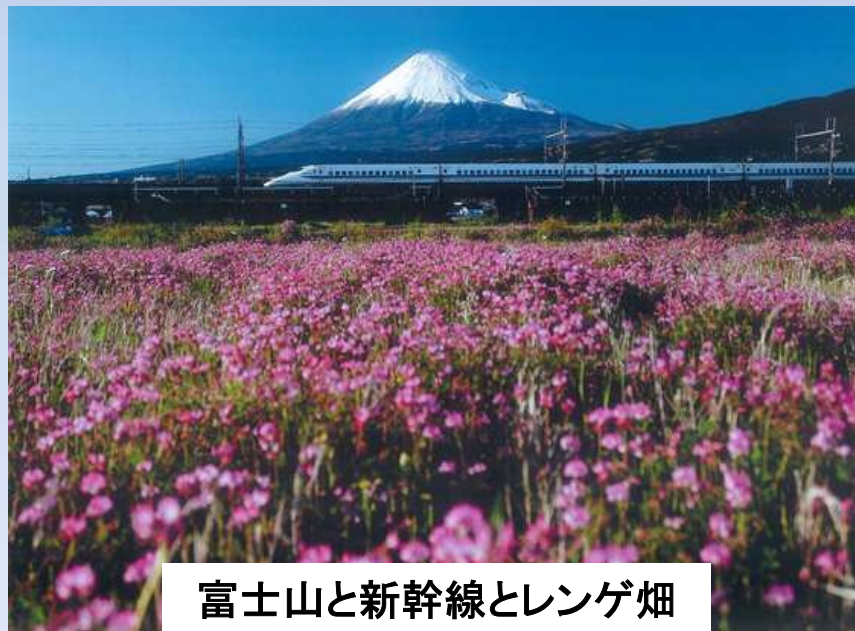
富士山と新幹線とレンゲ畑