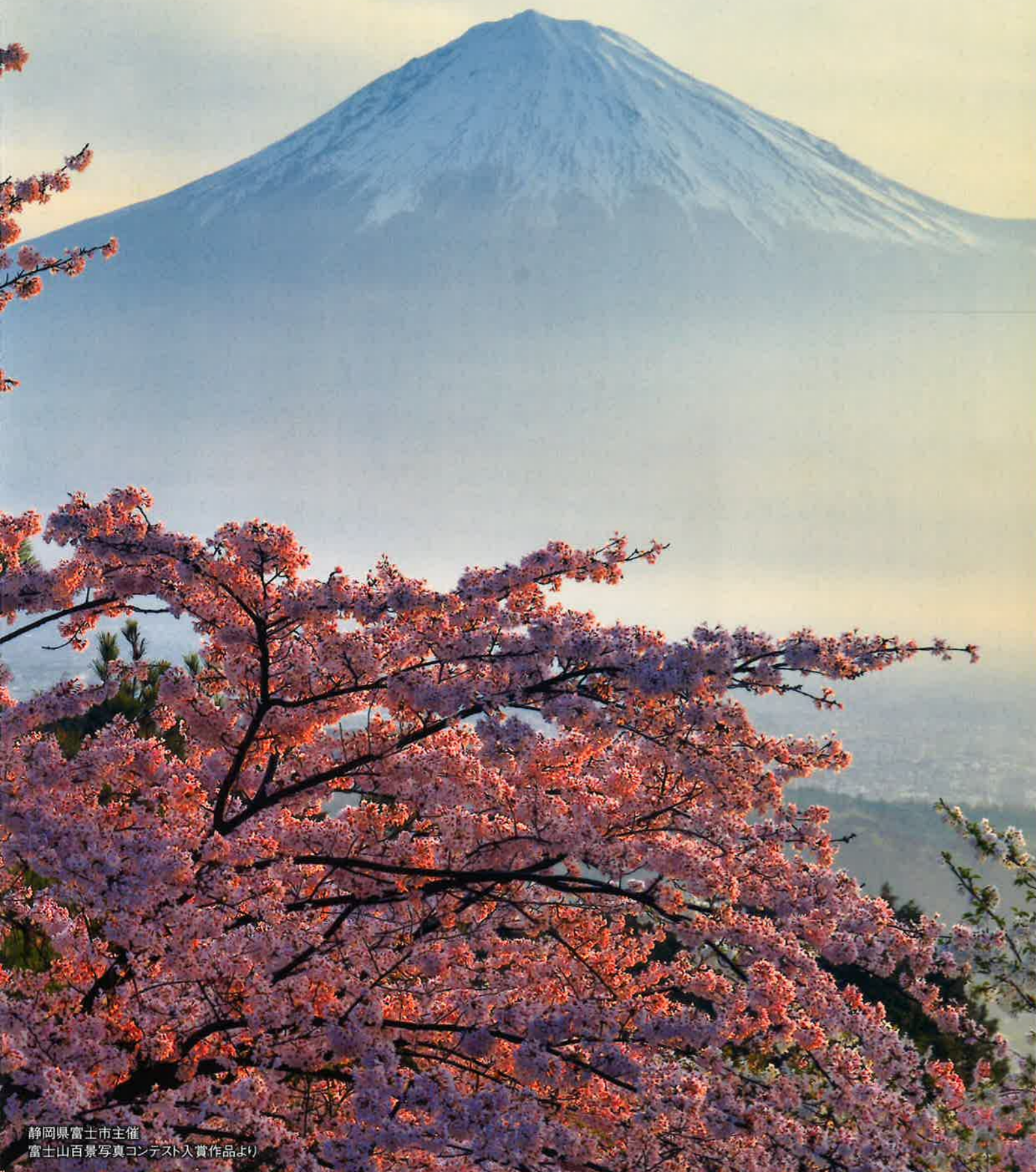
静岡県富士市主催 富士山百景写真コンテスト入賞作品より