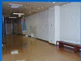
■2FビジネスコーナーA・B