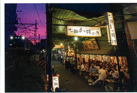
優秀賞 【昭和の風情】 南 司郎