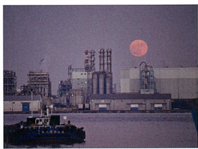
優秀賞 【スーパームーン】 藤枝 計夫