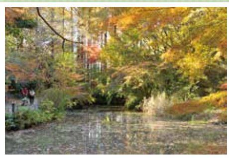
優秀賞 【秋の散歩道】 太田桃子