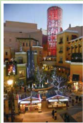
優秀賞 【暮れかかる華やかな街】 渡辺孝行