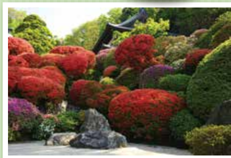
優秀賞 【春めく音色】 鶴岡邦央

川崎の自然風景、都市景観、伝統行事、イベントなど川崎の魅力を、広く市民や他都市の方々に伝える作品を募集しております。奮ってご応募下さい!