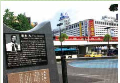
優秀賞 【昔日の風に煌いて】 小林紀美枝