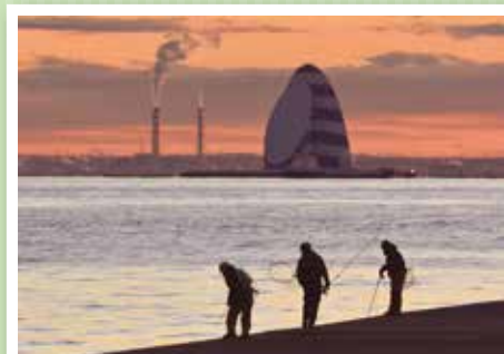
優秀賞 【風の塔の朝】 大上英明