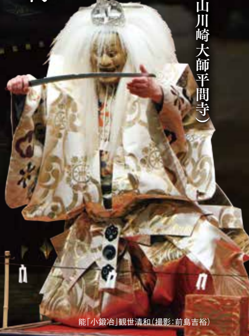
能「小鍛冶」観世清和

雨天時：信徒会館 ※雨天時は、会場への都合により、5階チケット購入者のみの入場とさせていただきます。