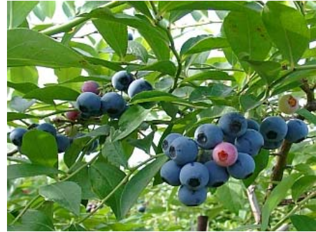
ブルーベリー(イメージ)