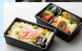
国内線ビジネスクラス級のお弁当付き