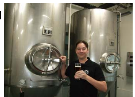
ブリマー・ブルーイング(株)

旅行企画・実施:京急観光株式会社 観光庁長官登録旅行業第297号 日本旅行業協会正会員 〒221-0056 神奈川県横浜市神奈川区金港町6-10