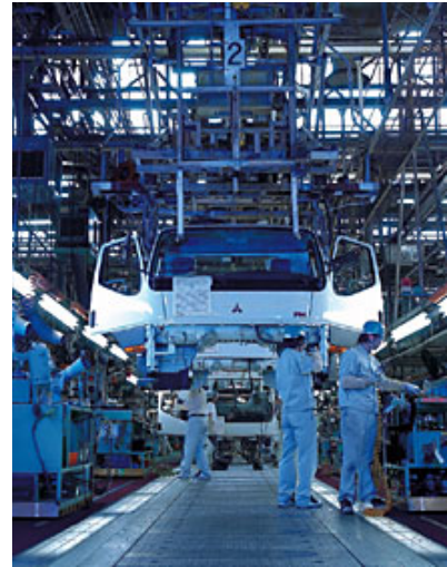
三菱ふそうトラック・バス(株)川崎製作所