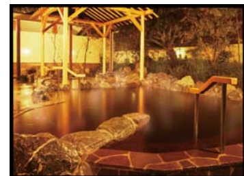
溝口温泉・喜楽里

旅行企画・実施:京急観光株式会社 観光庁長官登録旅行業第297号 日本旅行業協会正会員 〒221-0056 神奈川県横浜市神奈川区金港町6-10