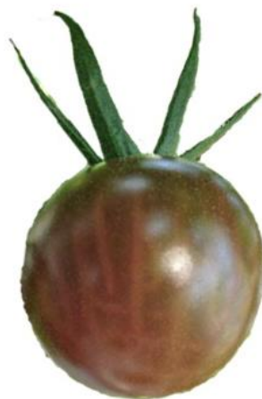
トスカーナ バイオレット

「黒トマト」ともいわれる 赤紫色のミニトマト！ アントシアニンを含み 皮が薄くぶどうの様な食感で 甘みと酸味のバランスも良く フルーツの様な食味です♪