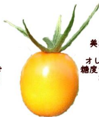
ピッコロ カナリア

「黒トマト」ともいわれる 赤紫色のミニトマト！ アントシアニンを含み 皮が薄くぶどうの様な食感で 甘みと酸味のバランスも良く フルーツの様な食味です♪