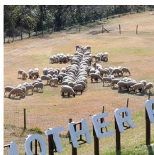
平成27年 (2015) 干支「未」