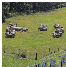
平成29年 (2017) 干支「トリ」