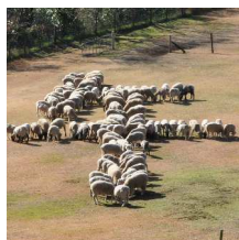
平成26年 (2014) 干支「午」