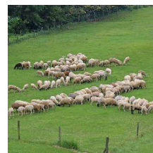
平成31年 (2019) 干支「亥」