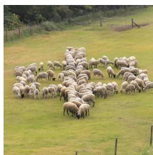
平成28年 (2016) 干支「申」