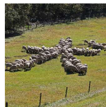
平成30年 (2018) 干支「犬」