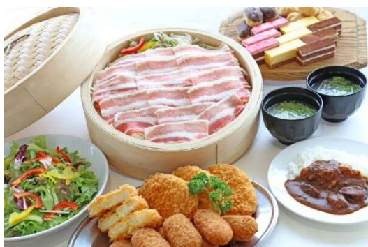
名水もち豚のせいろ蒸し