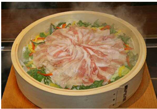
名水もち豚せいろ蒸し