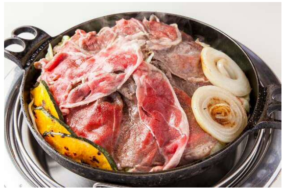
または ジンギスカン