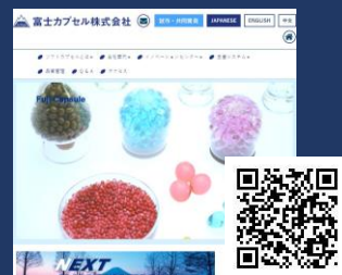
[富士カプセル株式会社様] - コーポレートサイト -