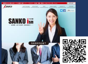
[株式会社三幸コーポレーション様] - コーポレートサイト -