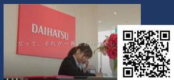
[ダイハツ沼津販売株式会社様] - リクルート動画 -