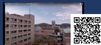
[法政大学経済学部様] - 学校紹介動画 -

貴社の動画素材を拝見し、予算ご相談の上活用方法をご提案いたします！ 撮影からのご相談もお待ちしております。