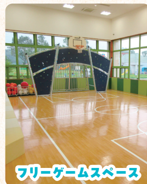
フリーゲームスペース