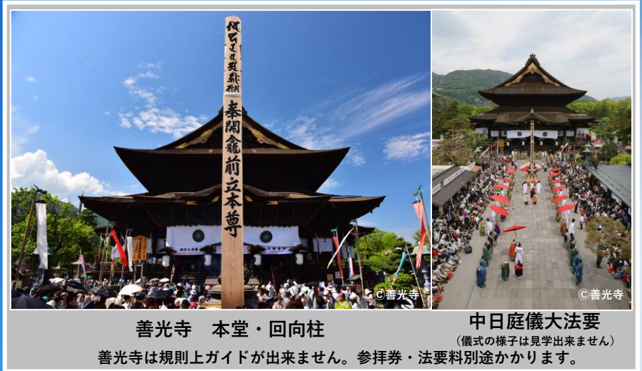
善光寺 本堂・回向柱 中日庭儀大法要 (儀式の様子は見学出来ません) 善光寺は規則上ガイドが出来ません。参拝券・法要料別途かかります。

今年は何と！ 七年に一度の 盛儀が同時開催 昨年順延になった長野善光寺前立本尊御開帳と本年実施予定だった諏訪御柱祭が今年一緒に開催する事が決まりこれは戦後初めての事だそうです。また今回は善光寺と北向観音の両参りを組み入れた特別な御利益満載企画となります。 *御柱祭を見学するツアーではありません