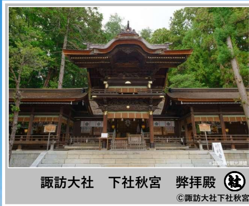
諏訪大社 下社秋宮 弊拝殿

今年は何と！ 七年に一度の 盛儀が同時開催 昨年順延になった長野善光寺前立本尊御開帳と本年実施予定だった諏訪御柱祭が今年一緒に開催する事が決まりこれは戦後初めての事だそうです。また今回は善光寺と北向観音の両参りを組み入れた特別な御利益満載企画となります。 *御柱祭を見学するツアーではありません