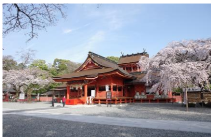
富士山本宮浅間大社