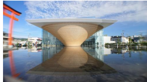
静岡県富士山世界遺産センター