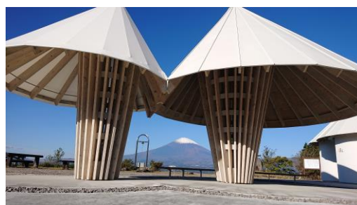
誓いの丘・誓いの鐘