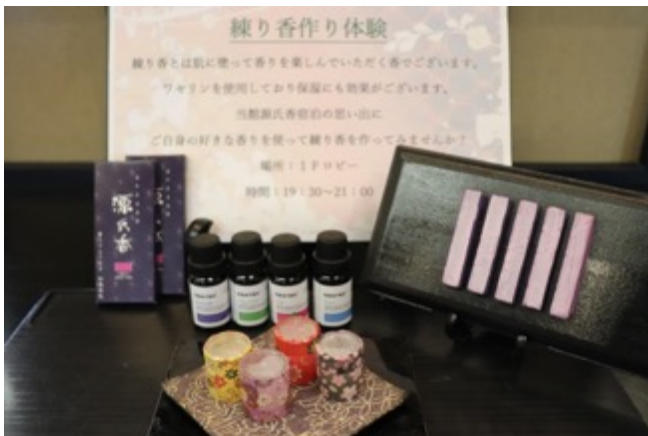
練香の体験のセット