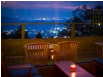
お部屋からの景色