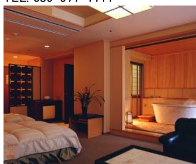
展望露天風呂付客室(洋室)