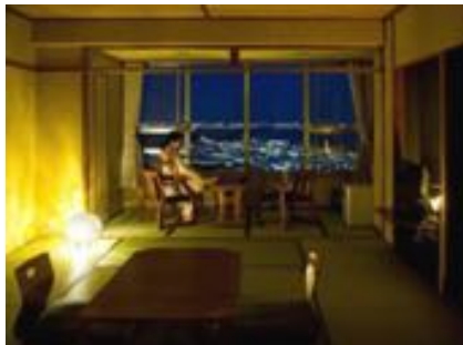
お部屋からの夜景