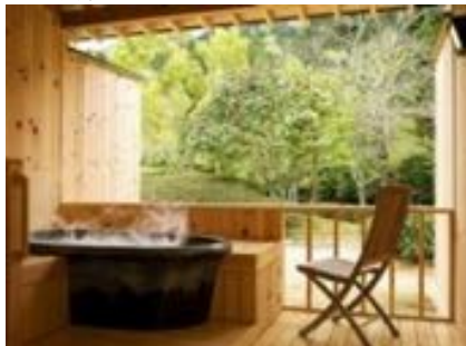
露天風呂付きお部屋