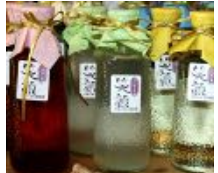
女将の会が開発したリキュール「笑顔」