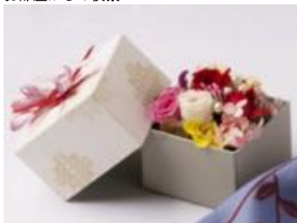
プリザーブドフラワー