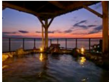
夕日の見える露天風呂