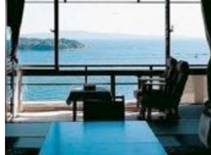
海が見えるお部屋