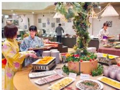
バイキングイメージ