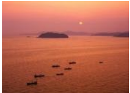
ロビーからご覧いただける、落陽シーン