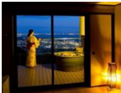
お部屋の露天風呂