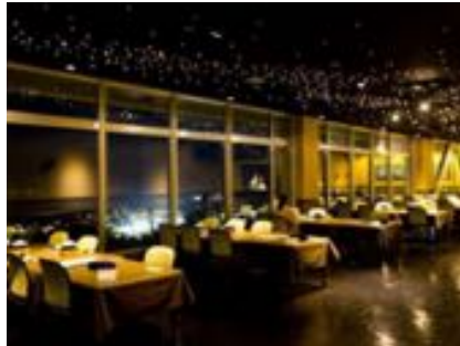
夜景の綺麗なレストラン