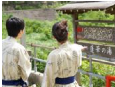
露天風呂に向かうイメージ