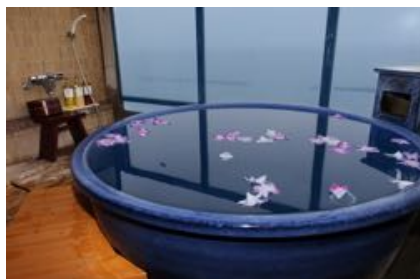
お部屋の露天風呂に浮かべたお花