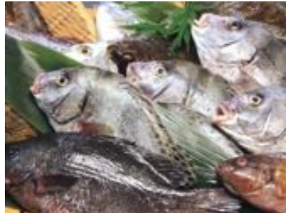
豊浜漁港から獲れたての海の幸