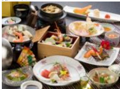
食の匠・料理長厳選料理の一例