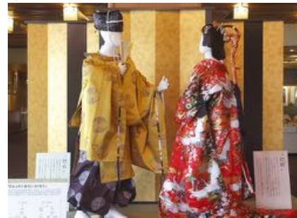
吉良上野介と富美子夫人の展示