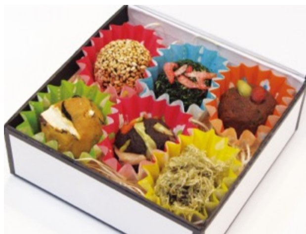
みそまる作りイメージ

全国味噌工業協同組合連合会によると、米の消費減少や食生活の変化で、年々出荷量が減少し続けている味噌ですが、発酵食品ブームにより、2016 年には久々に出荷量が微増に転じていると発表されています。また、海外では、大豆が「畑の肉」と言われるほど豊富にタンパク質を含むことや、近年の日本食ブームなどにより、味噌にも注目が集まっていることから、財務省の貿易統計結果によると、日本から海外への味噌の輸出量は、1997 年 1,012 トンから、2018 年は 17,009 トンと、年々増加となっています。