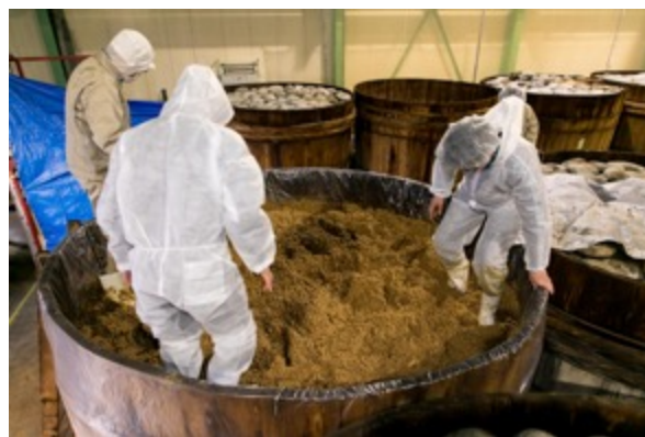
2017 年 12 月 6 日、味噌の仕込みの際の様子