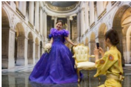
シンデレラに返信できる「写真館」