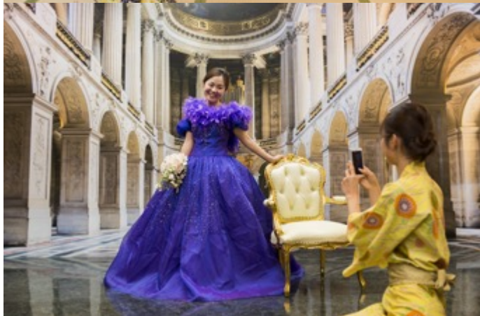
↑ 女性専用宿・花かざし／姫になりきり写真館