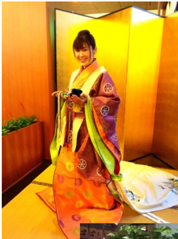
↑ 千の杜、斎王の宮 十二単体験