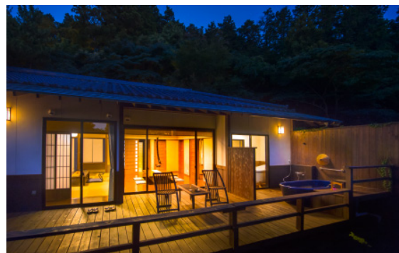
↑風の谷の庵 露天風呂付き隠れ家