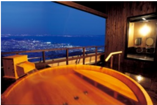
↑天の丸 屋上露天大浴場

蒲郡温泉の天の丸・風の谷の庵、西浦温泉の龍城(ホテルたつき)・花かざしは、蒲郡市観光協会がクラウドファンディングを通じて実施する「がまごおり未来チケット」応援プロジェクトに参画します。 https://camp-fire.jp/projects/view/264294