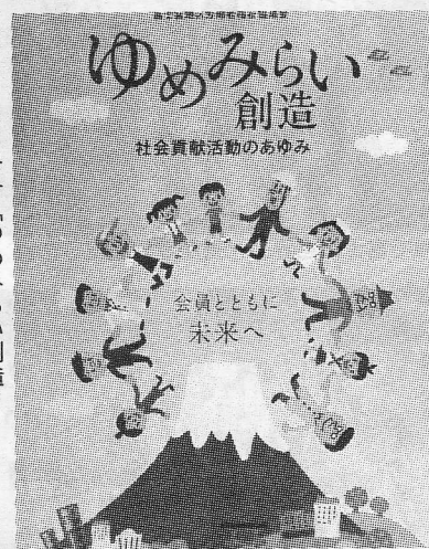
冊子「ゆめみらい創造」