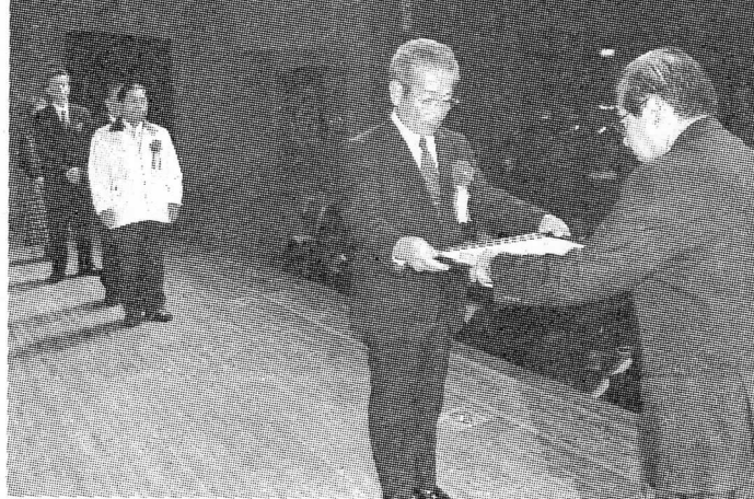
表彰される功労団体関係者

2015年富士宮安 全・安心まちづくり市 民大会・第33回暴力追 放・銃器根絶市民大会 が17日、富士宮市民文 化会館で開かれた。市 暴力団追放推進協議会 功労表彰として5団体 が表彰されたほか、石 川一広区長会長（同協 議会副会長）が大会宣 言を行った。