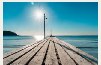
岡本棧橋 (車で 23分)