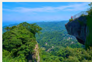
鋸山地獄のぞき (車で 5分)